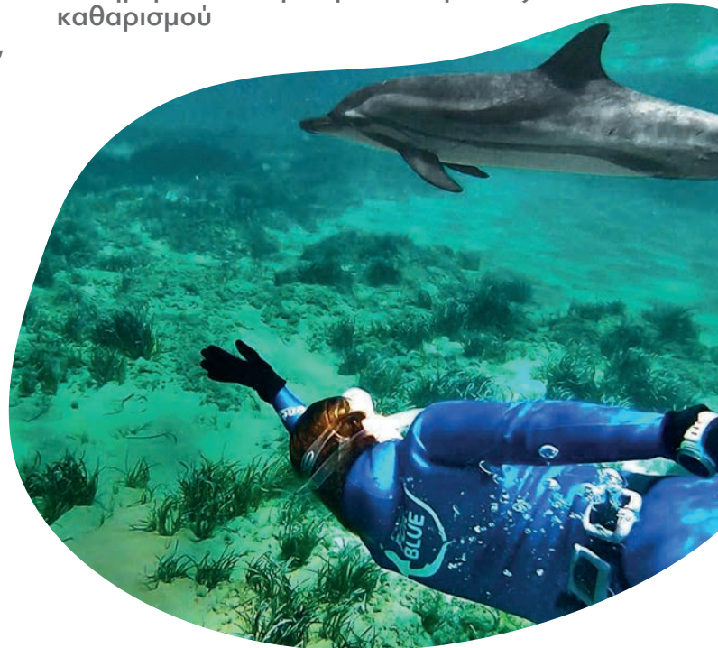
Επανάτηξη δελφινιού στις Κυκλάδες