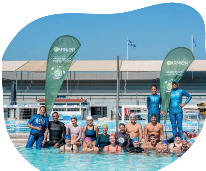
Σχολείο Ελεύθερης Κατάδυσης