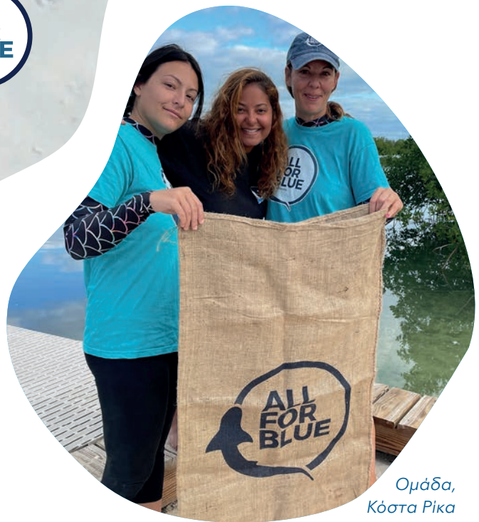
Ομάδα, Κόστα Ρίκα