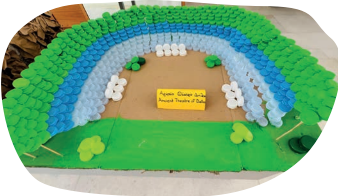
Το αρχαίο θέατρο της Δήλου από πλαστικά καπάκια, Δημοτικό Άνω Μεράς