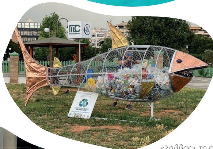
«Σάββας», το πρώτο «ανακυκλώψαρο» στον Άλιμο.