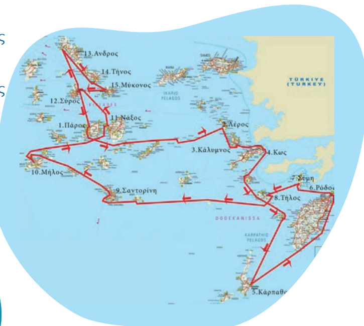
Πρόγραμμα αποστολής Keep Aegean Blue