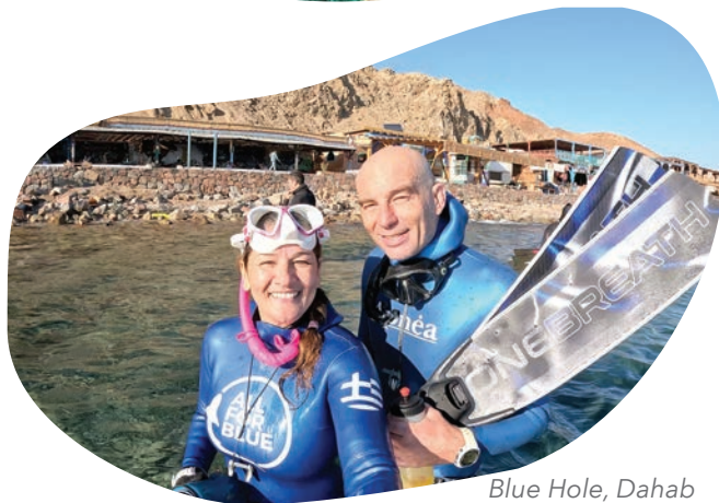
Blue Hole, Dahab