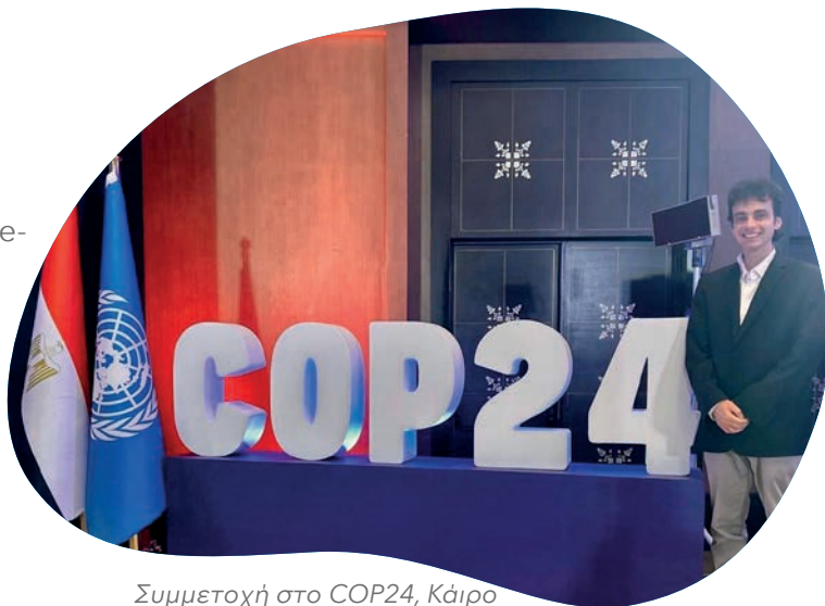
Συμμετοχή στο COP24, Κάιρο

• Βόλος: Εκπαιδευτικά σεμινάρια σε πάνω από 1000 μαθητές και παράκτιοι και υποβρύχιοι καθαρισμοί στην παραλία Σουτραλί και Άναυρος με την υποστήριξη της Garnier.