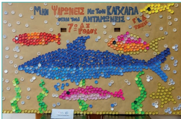
7ο Δημοτικό Σχολείο Ρόδου “Μην φαρώνεις με τον καρχαρία όταν τον ανταμώνεις”

Εφαρμόζοντας τις αρχές της κυκλικής οικονομίας και ενισχύοντας τη δημιουργικότητα των παιδιών, διοργανώνουμε εικαστικούς διαγωνισμούς στους διάφορους τόπους που επισκεπτόμαστε. Οι μαθητές / μαθήτριες μαζί με τους εκπαιδευτικούς τους δημιουργούν έργα τέχνης από απορρίμματα που συνέλεξαν, αναδεικνύοντας τη σημασία της επαναχρησιμοποίησης. Τα έργα παρουσιάζονται σε κεντρικά σημεία του τόπου και η ψηφοφορία των έργων γίνεται διαδικτυακά μέσα από την ιστοσελίδα του Οργανισμού. Οι νικητές βραβεύονται με επαναχρησιμοποιούμενο εξοπλισμό της All For Blue για παράκτιους καθαρισμούς και κάδους από ανακυκλωμένο πλαστικό για τα σχολεία τους.