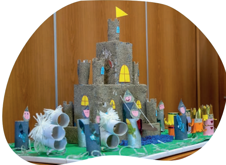
2ο Πειραματικό Δημοτικό Σχολείο Ρόδου “Το κάστρο των ιπποτών από ανακυκλώσιμα υλικά”